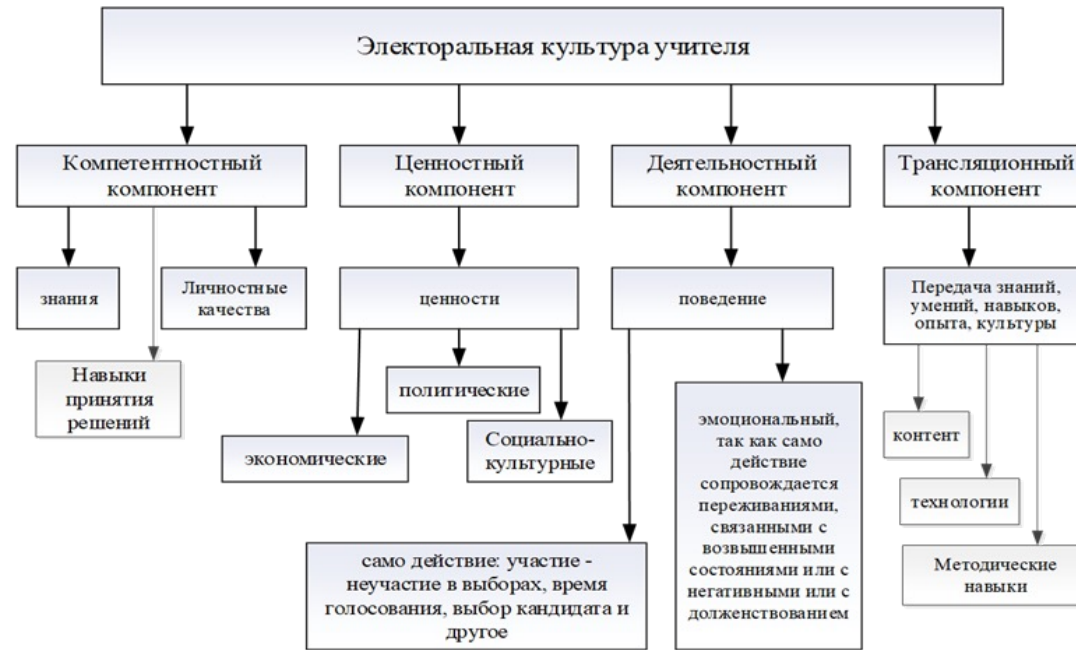
Рис.1. Структура электоральной культуры учителя