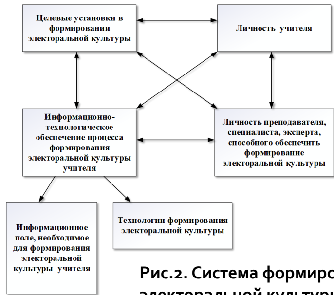
Рис.2. Система формирования электоральной культуры учителя