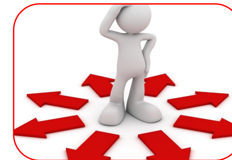
Комплексный подход к развитию